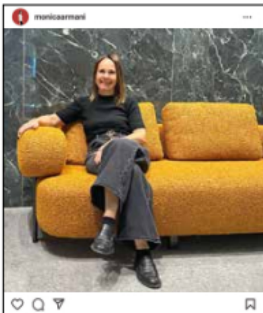
Einfach mal fallen lassen: Das klappt bestens mit dem gemütlichen Roma Sofa , das ich für TURRI entworfen habe