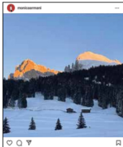
Ein wunderschöner Sonnenuntergang über den Dolomiten in Südtirol und ein wunderbarer Abend mit guten Freunden