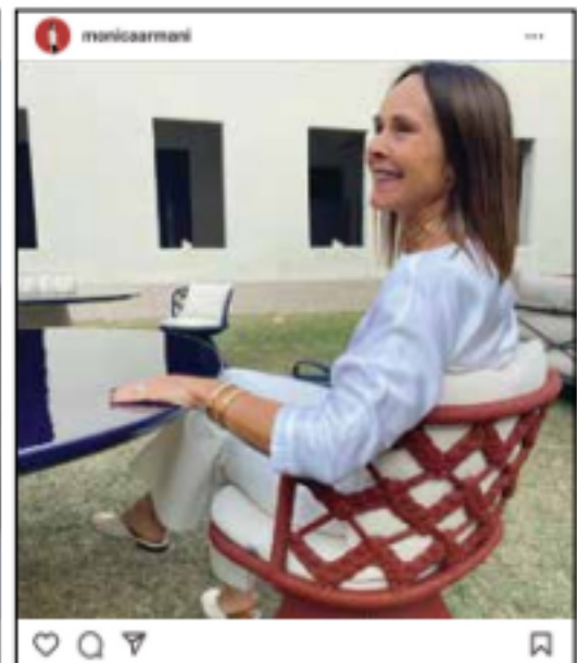
Für den Outdoor-Stuhl Flair O' für B&B ITALIA habe ich mich von einem meiner Sommerkleider inspirieren lassen