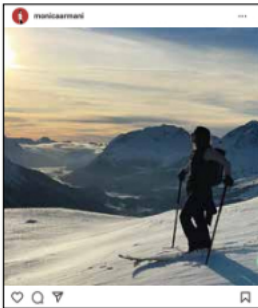
Ich genieße in Sankt Moritz einen Freeride bei Sonnenuntergang. Der Ausblick über die Schweizer Alpen ist unvergleichlich

Seit über 25 Jahren entwirft die italienische Designerin zusammen mit ihrem Mann Luca Möbel und Accessoires für Hersteller wie B&B ITALIA, TURRI, KFF oder LUCEPLAN